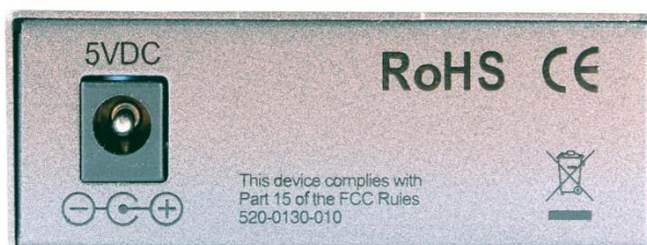
Рис.2 Вид сзади медиаконвертеров OMC-1000-11S5a (OMC-1000-11S5b)