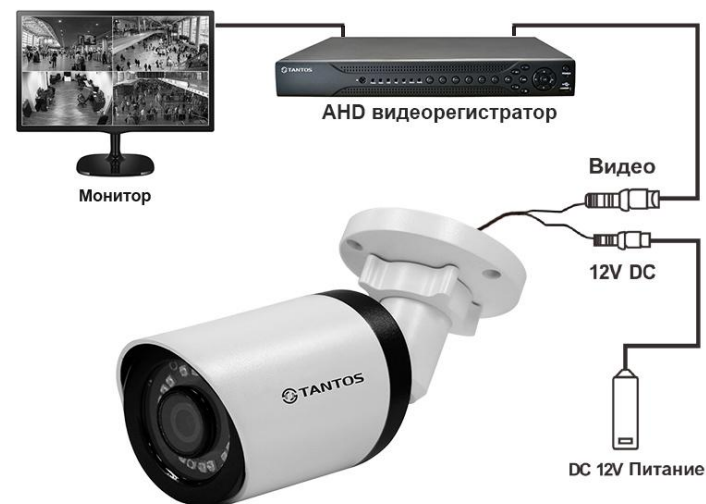
Схема подключения HD видеокамеры: