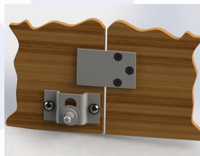
Ригель на дверях из ЛДСП

При подаче напряжения замок разблокируется, но дверь остается закрытой. Для открытия разблокированной двери необходимо нажать на нее, замок встроенным толкателем оттолкнет и приоткроет дверь. Если на дверь не нажали, то после снятия напряжения питания замок заблокируется и дверь останется запортой. Это позволяет одним контроллером СКУД управлять сразу группой замков, расположенных на соседних витринах.