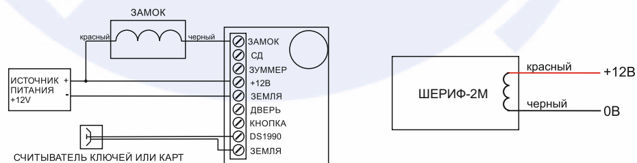
Схема подключения замка «Шериф-2М» к контроллеру (на примере контроллера JSB-CL002)

Для работы замка необходим источник питания и контроллер СКУД. Для открытия замка контроллер СКУД должен подать на замок напряжение и удерживать данное состояние до момента открытия двери.