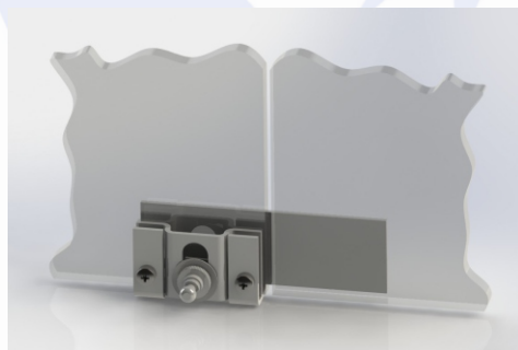
Ригель на стеклянных дверях

Замок устанавливается на неподвижной поверхности. Ответная часть (ригель) устанавливается на дверь. Если двери две, то вторая дверь запирается запорной планкой.