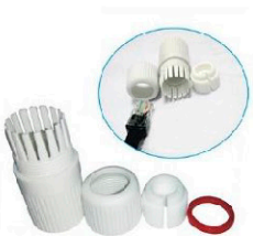
Монтажный комплект для влагозащиты (опция)