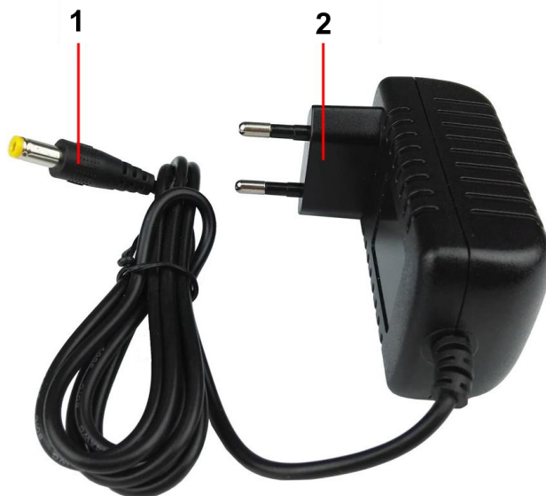
Рис. 1 Блок питания PS-5010, внешний вид, разъемы