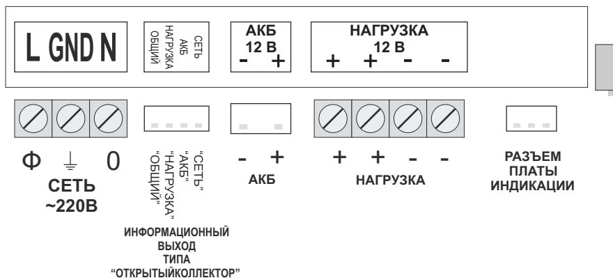
СХЕМА ИНФОРМАЦИОННОГО ВЫХОДА