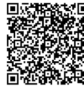
Android App QR

Используйте телефон Android или iOS для сканирования соответствующего QR-кода или поиска "BitVision" из магазина приложений для загрузки и установки приложения BitVision.