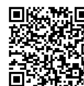
iOS App QR