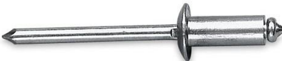
Рисунок 2 - внешний вид заклепки