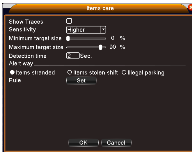
Рис 3 Установка правил – Элементы тревоги