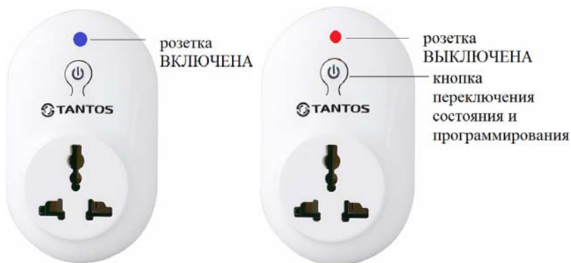
Рисунок 1. Беспроводная розетка