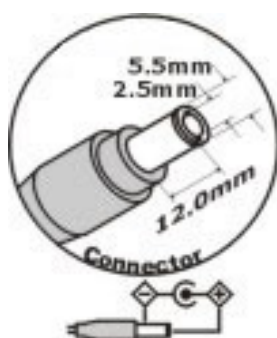
схема разъёма питания

Питание (12 V) для внешнего микрофона в данном случае можно подключить от разъёма питания видеокамеры