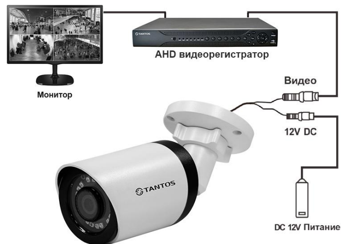
Схема подключения HD видеокамеры: