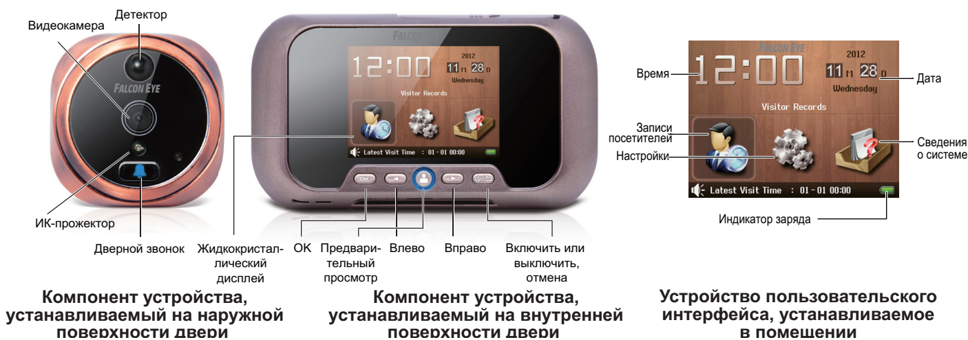
Компонент устройства, устанавливаемый на наружной поверхности двери