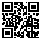
Скачать iVMS 4.5