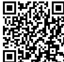
Прошивки и утилиты