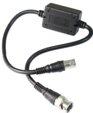
Рис.1 Изолятор I-НС, внешний вид