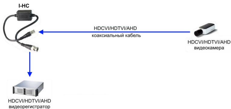
Рис.3 Типовая схема подключения изолятора I-НС через коаксиальный кабель