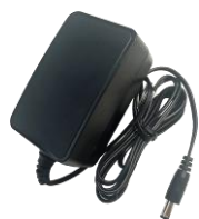
MSA-C1500IC12.0-18P-US MSA-C1500IC12.0-18P-GB MSA-C1500IC12.0-18P-JP Адаптер питания