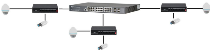
Управляемый коммутатор уровня 2