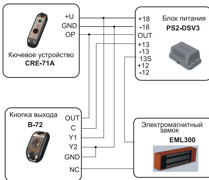
Рис.1 Схема подключения КУ

расположенной на лицевой панели, или нажатии КВ происходит отключение ЭМЗ – дверь открыта.