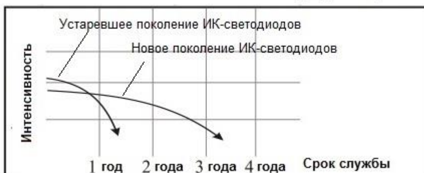
График зависимости интенсивности свечения ИК-светодиодов от срока эксплуатации

В данной видеокамере используются ИК-светодиоды нового поколения, которые являются более долговечными и яркость их свечения уменьшается гораздо медленнее, чем яркость свечения ИК-диодов предыдущих поколений.