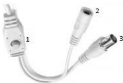
Кабели и разъемы