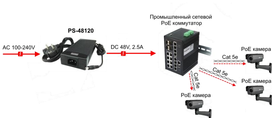
Рис.3 Типовая схема подключения блоков питания на примере PS-48120