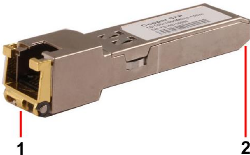
Рис. 2 SFP-модули SFP-TP-RJ45, SFP-TP-RJ45/I, разъемы