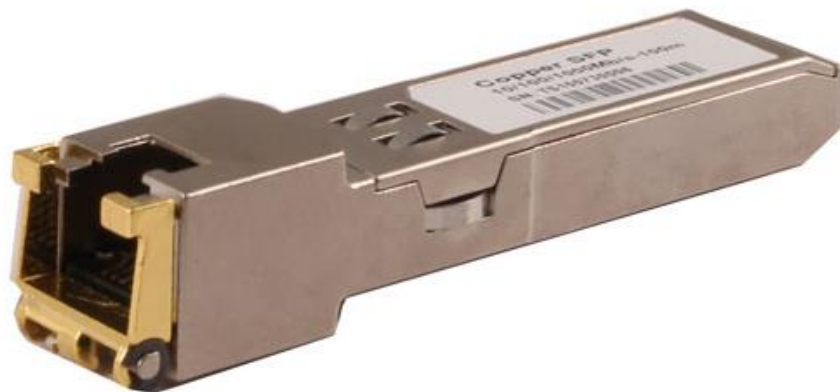
Рис.1 SFP-модули SFP-TP-RJ45, SFP-TP-RJ45/I, внешний вид