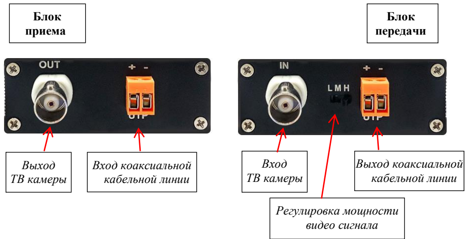
Рис. 1. Схема расположения точек коммутации передней панели блоков

Схема расположения элементов настройки и точек коммутации блоков приведены на Рисунках 1 и 2.