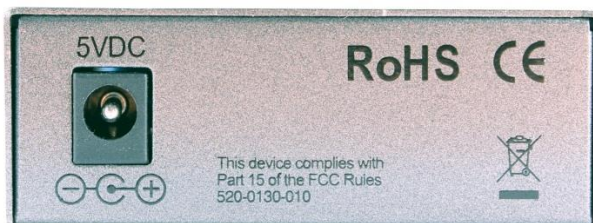
Рис.2 Вид сзади медиаконвертеров OMC-1000-11S5a (OMC-1000-11S5b)