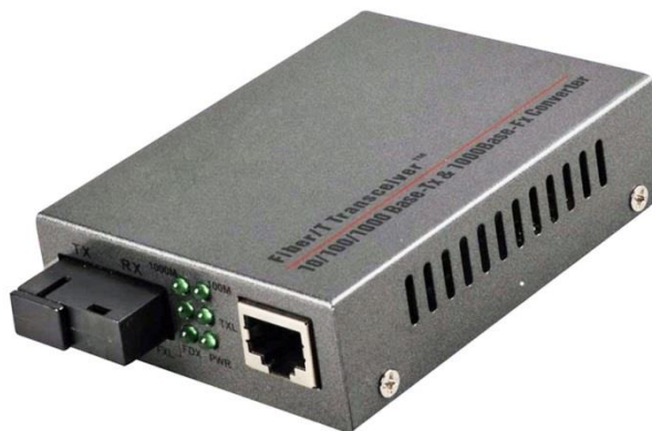
Рис. 1 Внешний вид медиаконвертеров OMC-1000-11S5a (OMC-1000-11S5b)