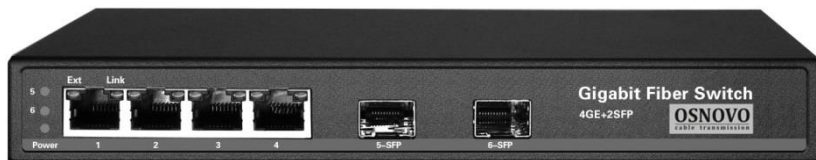
Рис.1 Коммутатор SW-7042 (вид спереди)