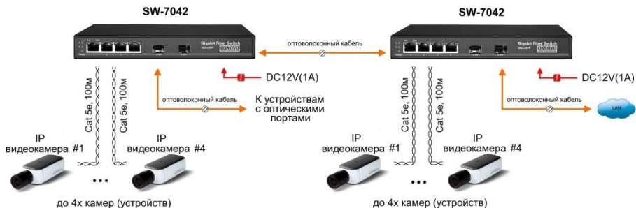
Рис.5 Схема каскадного подключения коммутатора SW-7042