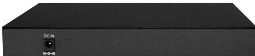
Рис.2 Коммутатор SW-7042 (вид сзади)