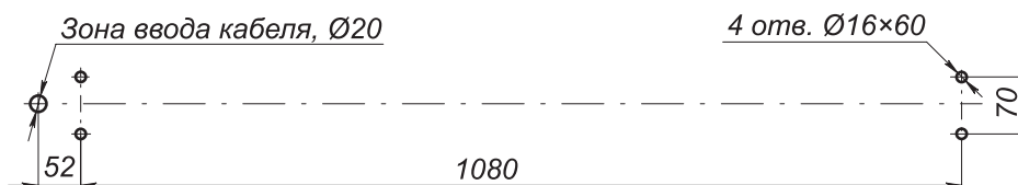
Разметка отверстий для монтажа калитки

На рисунке показана разметка отверстий для монтажа калитки. Для прокладки кабеля управления к замку в стойке рамы калитки предусмотрено отверстие.