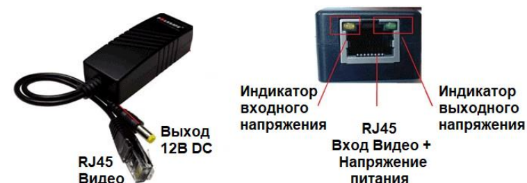
Рис. 1 Общий вид Изделия и назначение его контактных выводов и гнезд

4.1. Общий вид Изделия и назначение его контактных выводов и гнезд показано на Рисунке 1: