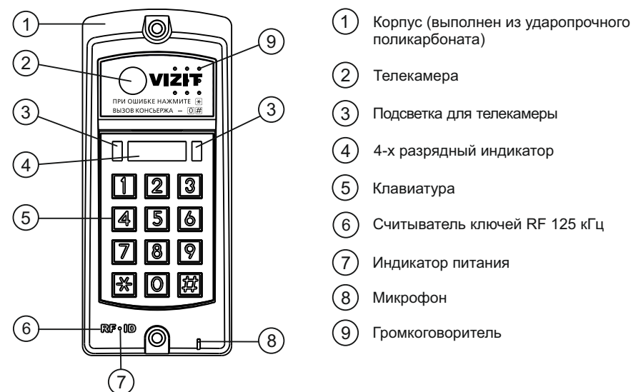
Рисунок 1 - Внешний вид блока

Блок вызова домофона БВД-317RCBW (в дальнейшем - блок вызова) используется совместно с блоками управления БУД-302М, БУД-302S, БУД-302К-20, БУД-302К-80, БУД-302S-20, БУД-302S-80, БУД-430, БУД-430М, БУД-430S, БУД-485, БУД-485М и БУД-485Р как составная часть многоквартирных домофонов и видеодомофонов VIZIT (серии 300, 400).